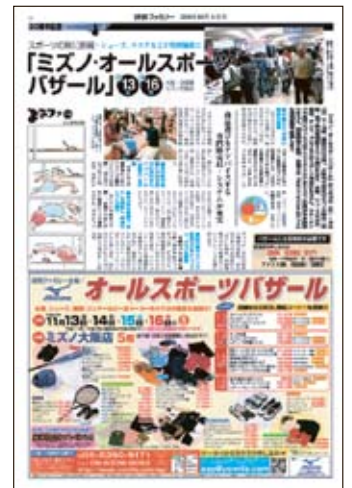
広告と連動した紙面記事の例