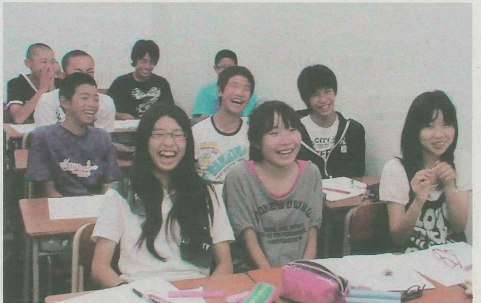
中学部クラス 授業が楽しく、どんどん勉強が好きになる