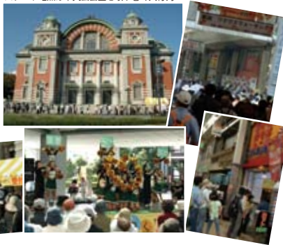
スタート地点は中央公会堂を取り巻く大行列

コースで通った九条通商店街のお好み焼き屋さん、たこ焼き屋さん、豚まん屋さんは早々に完売！