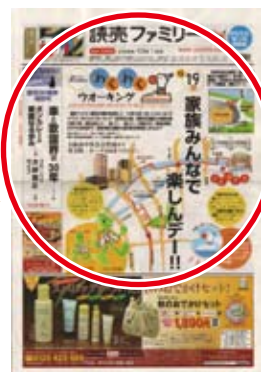
◀ 読売ファミリー紙面で告知