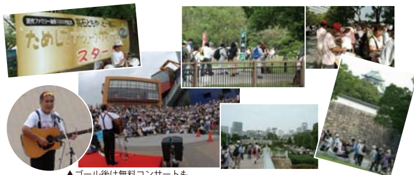
▲ゴール後は無料コンサートも