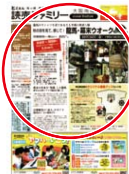
◀ 読売ファミリー紙面で告知